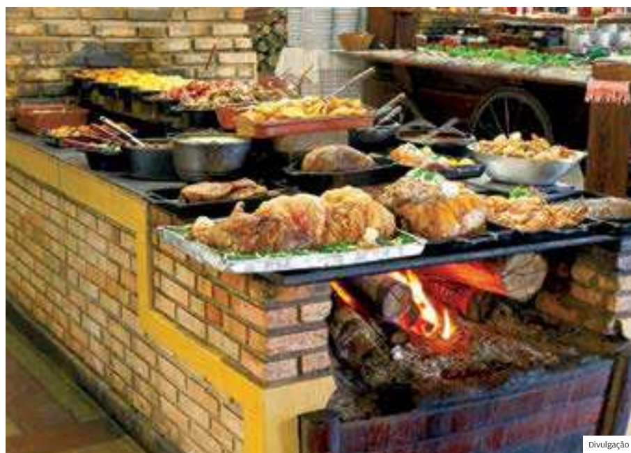
Gastronomia. Almoço com fogão à lenha é um dos destaques da Fazenda da Comadre

O Restaurante Fazenda da Comadre é um local agradável e tranquilo onde os visitantes podem passar horas de lazer e gastronomia. ■