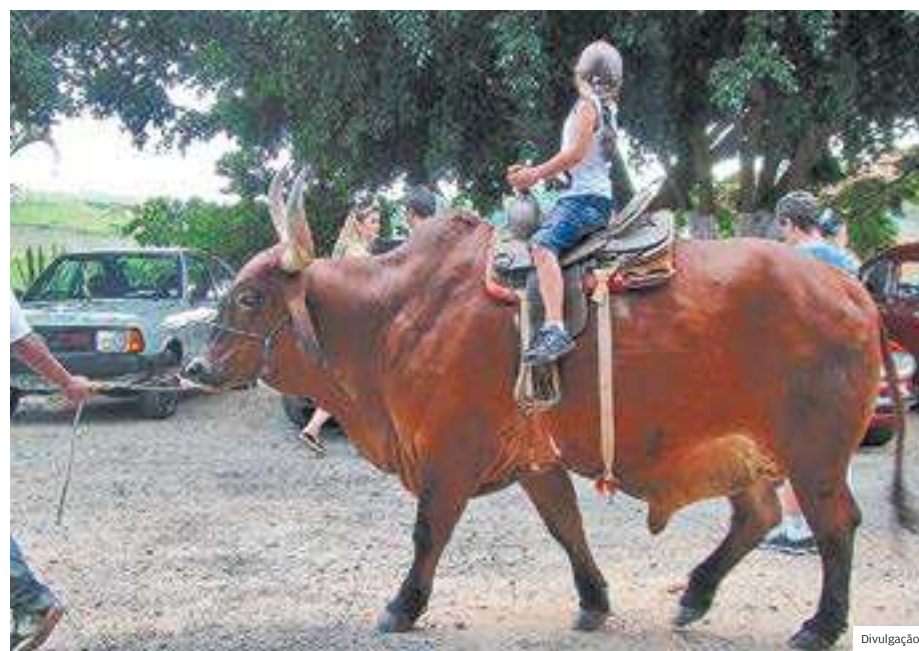
Natureza. Passear em cima do boi é uma das atrações oferecidas pelo local