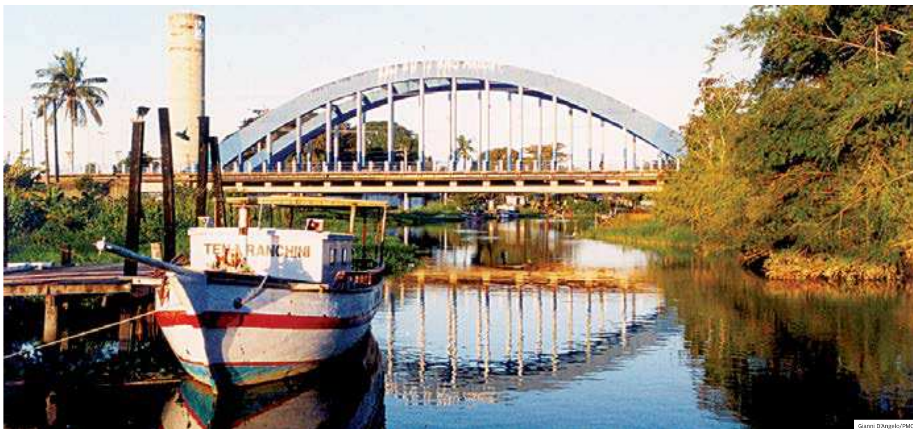
Aquecimento. Visão do rio Juqueriquerê e ponte de arco no bairro Porto Novo, em Caraguatatuba; Conselho de Turismo quer profissionalizar o turismo no município

COMTUR NOVA PRESIDENTE DO CONSELHO TEM COMO PRINCIPAL DESAFIO REDUZIR A SAZONALIDADE DO MUNICÍPIO QUE VIVE DO TURISMO