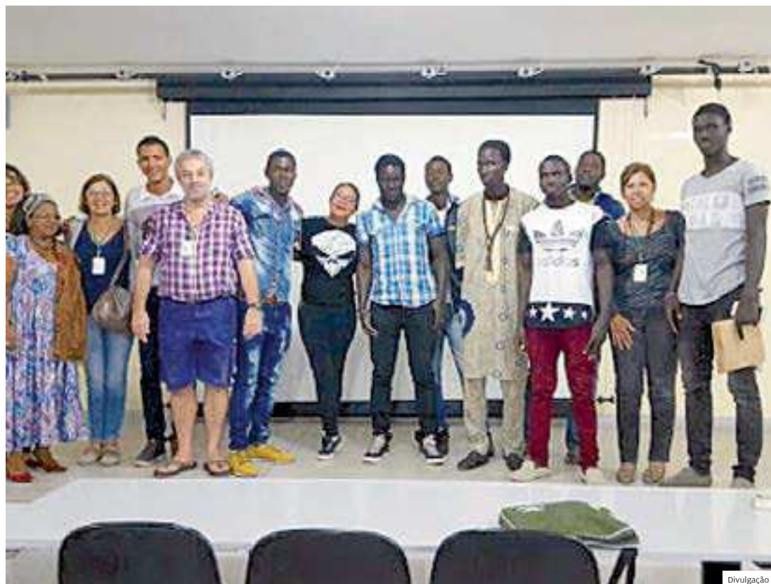
Cultura. A ONG Zambô também vem dando andamento ao Projeto de Extensão 'Touba', no Litoral

Fundação Cultural disponibiliza um espaço público na cidade para que os imigrantes possam se encontrar regularmente