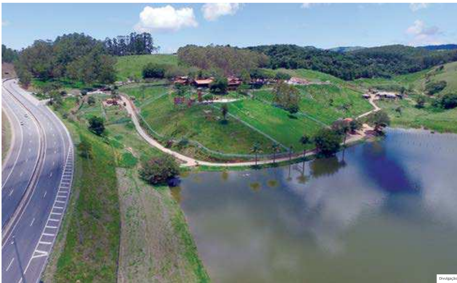
Parada obrigatória. Vista aérea da Fazenda da Comadre, em São José dos Campos, que oferece diversas opções de lazer aos visitantes

O restaurante funciona desde sua fundação, há quase 20 anos, dentro de uma fazenda, cercado de natureza e um grande lago. Uma horta cultivada nas dependências do local oferece verduras e legumes frescos utilizados no