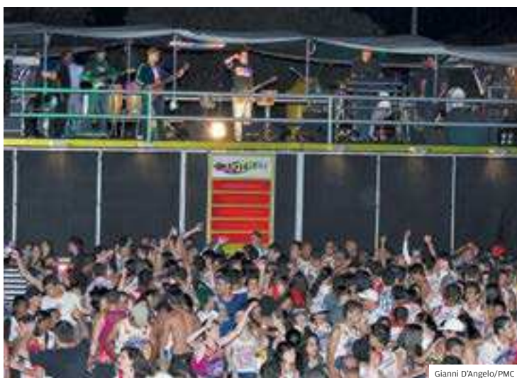
Agitação. Trio elétrico em carnaval fora de época em Caraguatatuba

para assumir o cargo e movimentar o trade turístico.