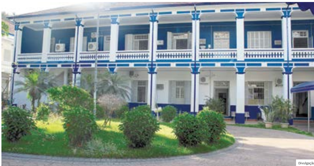
De novo. Palácio do Bom Conselho, sede da Prefeitura de Taubaté. Novos concursos estão previstos

O edital cita o interesse em abrir concursos públicos para 25 cargos: agente de trânsito, assistente social, braçal, coletor, cuidador, dentista, dentista especialista, enfermeiro, escriturário, instrutor de artes, médico, médico especialista, motorista, motorista paramentador, pedreiro, pedreiro de acabamento, pintor, técnico de enfermagem, técnico de equipamento odontológico, técnico de necropsia, técnico de raio-x, técnico de saúde pública, técnico de segurança do trabalho, técnico em farmácia e