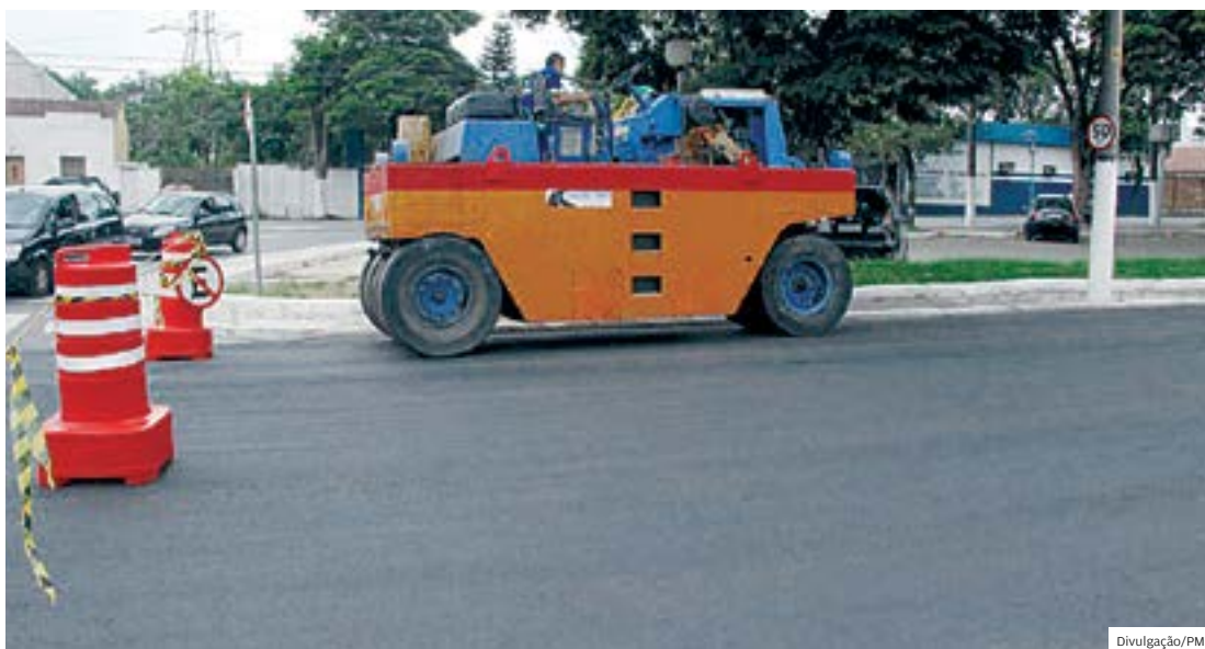
Pavimentação. Das oito licitações finalizadas, três são de pacotes para requalificar ruas e avenidas

A previsão inicial do governo Ortiz era de que a liberação ocorresse em três meses, mas o aval do governo federal para a operação de crédito demorou 26 meses.