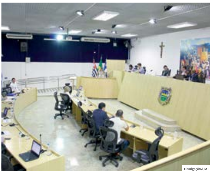
Farra mais tímida. Após ação do jornal, viagens e despesas caíram

Segundo levantamento feito pela reportagem, entre janeiro e agosto foram registradas 381 viagens de vereadores, o que representa uma média de 47 por mês. Entre setembro e dezembro, período pós ação, foram 117 viagens, uma mé-