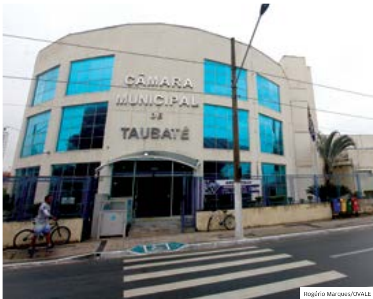
Justiça. Jornal move ação para obter acesso a relatório de viagens

Ao todo, as quase 500 viagens realizadas no ano passado tiveram 58 diferentes des-