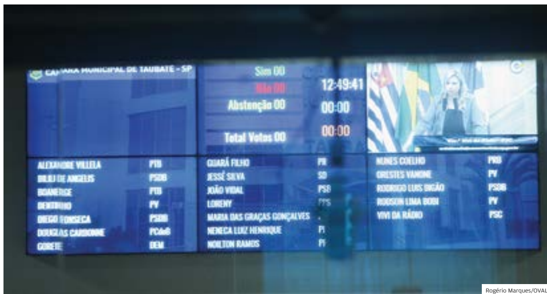
Surpresa. Painel eletrônico instalado na Câmara de Taubaté será 'inaugurado' na segunda-feira, dia 5

O painel, que registra presença e voto dos vereadores, será apresentado aos eleito-