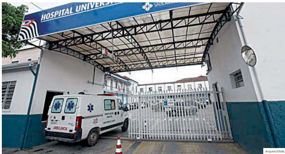
Aposta por mais vagas. Município quer retomar a gestão do Hospital Universitário a partir de maio