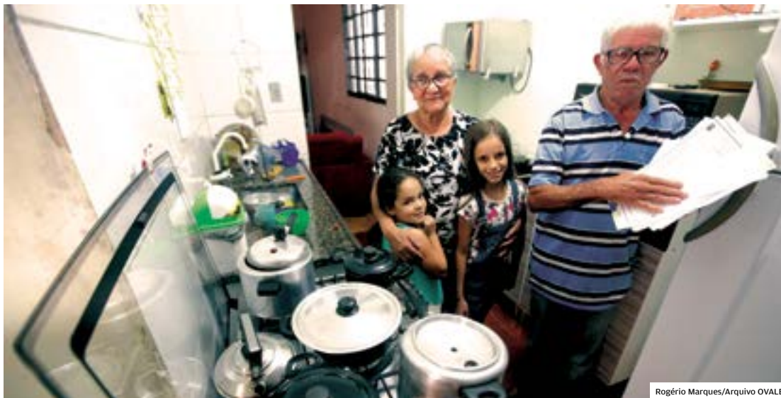
Bolsa Família. Moradores de São José atendidos pelo programa mostram documentos para cadastro

O pagamento do Bolsa Família de dezembro começou na última segunda-feira e segue