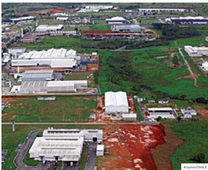
Uma empresa a menos. Vista do Distrito Industrial de Taubaté

A Bontaz, que funciona em um galpão alugado em Pindamonhangaba, pretende se expandir e, para isso, quer uma área maior. Em janeiro, a empresa deu entrada com dois pedidos de doação de área: um em Taubaté e outro em Pinda.