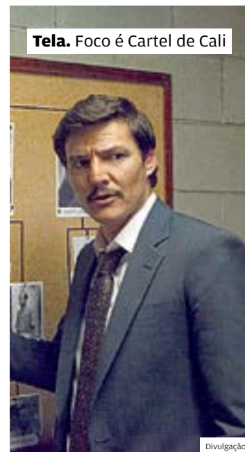
Tela. Foco é Cartel de Cali

A série é dirigida pelo cineasta brasileiro José Padilha, que dirigiu “Tropa de Elite” (2007) e “Tropa de Elite 2” (2010). ■