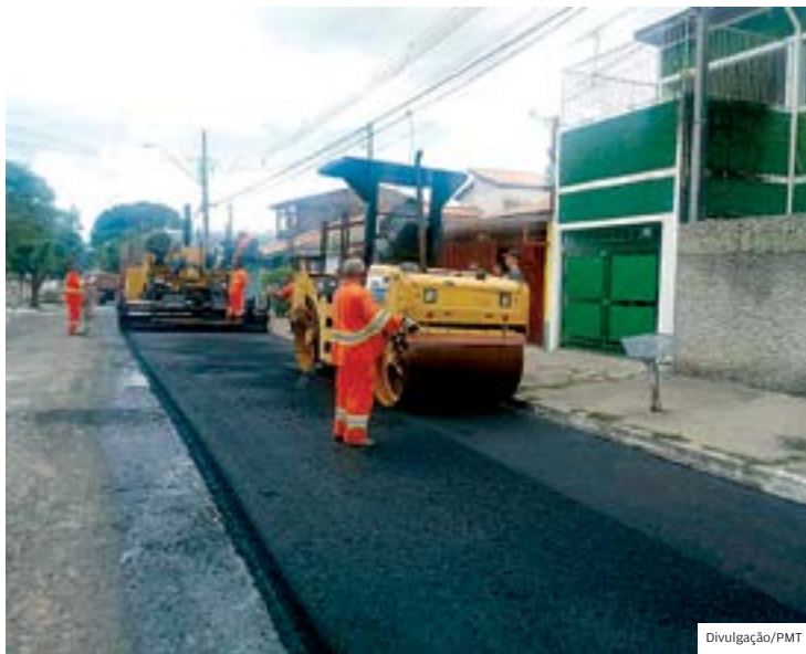
Publicidade. Obras do CAF viraram vitrine do governo Ortiz Junior

O material também cita as obras anti-inchentes do Par-