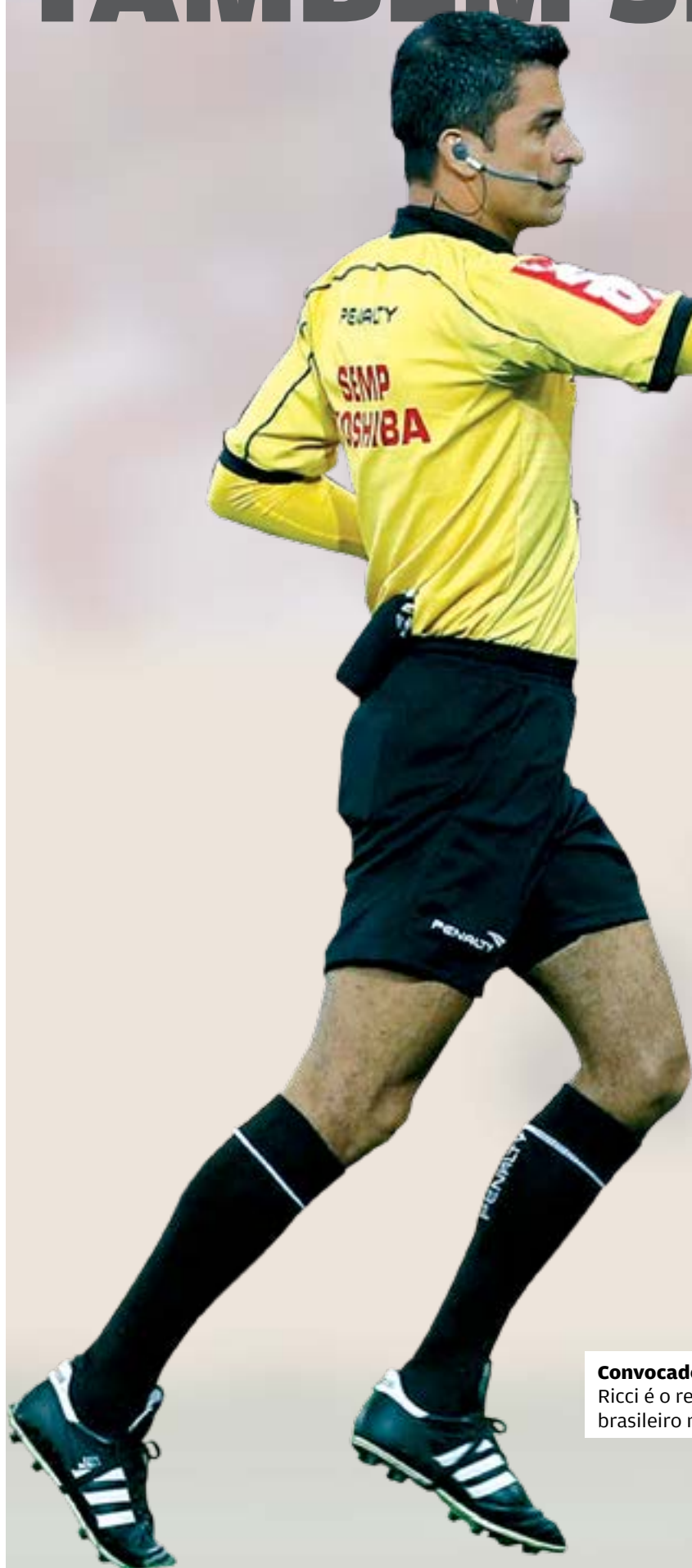
Convocado. Sandro Meira Ricci é o representante brasileiro na Copa 2018