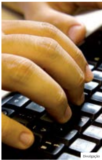
Regulado. Agora, provedores pode limitar navegação nos EUA

A lei que acaba com a neutralidade da rede nos Estados Unidos, um princípio que garantia a igualdade de acesso à internet, entrou em vigor nesta segunda-feira. A regulação da neutralidade na rede, aprovada durante o governo do ex-presidente Barack Obama, impedia que os provedores de internet bloqueassem ou diminuíssem a velocidade de acesso a determinados sites, alegando que a navegação online é um serviço público.