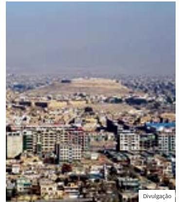
Ataque. Visão panorâmica de Cabul, capital do Afeganistão

O ataque ocorre um dia antes da entrada em vigor do cessar-fogo decretado pelo governo e a três para que os talibãs adotem a mesma prática por causa do fim do