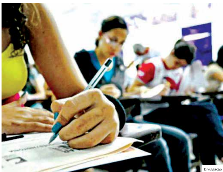
Simube. Esse ano, 120 estudantes foram contemplados com bolsas

“A gente tem uma lista que mostra algo que é muito gra-