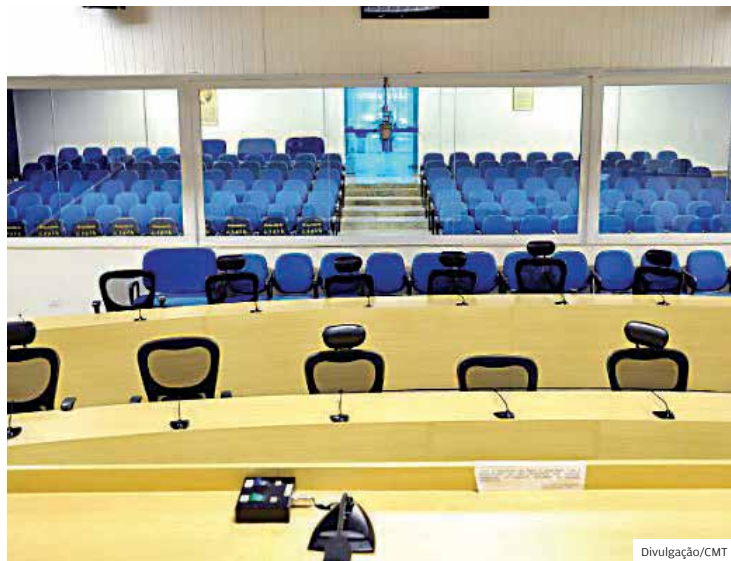
Trâmite. Projeto será analisado após o fim do recesso parlamentar

Pelo projeto, cada ausência não justificada em uma sessão levaria ao desconto de 5% do salário. O cálculo tem como base a média de 20 dias úteis por mês. Esse é o parâmetro usado também na