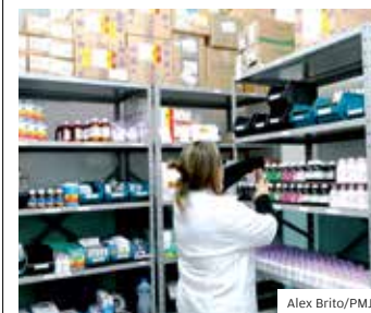
Ampliação. Farmácia 24 horas