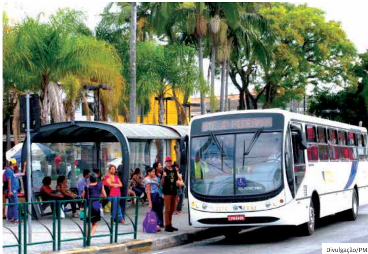
Usuários. Representantes serão votados por população esta quinta

Inicialmente, 16 pessoas se inscreveram para integrar o Conselho, que teve seis dias úteis para procedimento. Depois, com prorrogação de mais oito, outras cinco pessoas se candidataram para a eleição.