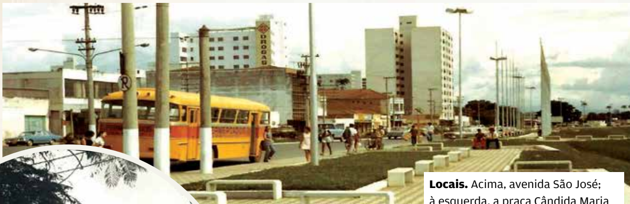
Locais. Acima, avenida São José; à esquerda, a praça Cândida Maria César Sawaya Giana; abaixo, local da futura av. Sen. Teotônio Vilela