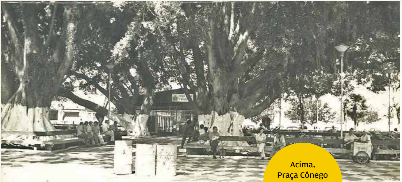
Acima, Praça Cônego Lima; e abaixo, avenida João Marson

de se perca. Creio que basta boa vontade”, cravou ele, que desde o início de seu projeto, usa recursos próprios para manter o site e todo o trabalho de pesquisa e digitalização do acervo.