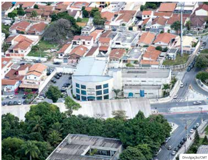
Mudanças. Projeto foi apresentado pela Mesa Diretora em agosto

Entre as medidas propostas estão a oficialização da extinção da Escola Legislativa, que já não tem nenhum servidor nomeado desde 2016, e a extinção, na vacância, dos cargos de motorista e seguranças deixarem a Casa, eles não serão repostos, o que abrirá brecha para a terceirização desses serviços - principalmente o de segurança, cuja intenção já foi anuncia-