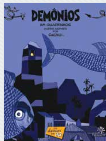
“Demônios” , de Aluísio Azevedo Por Eloar Guazzelli R$49 (Peirópolis)