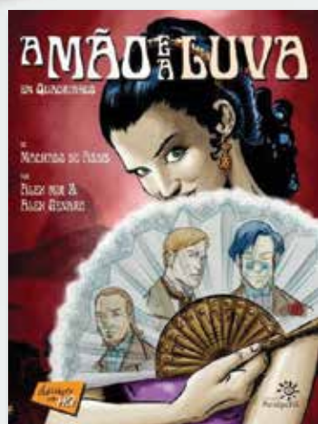
“A mão e a luva” , de Machado de Assis Por Alex Genaro e Alex Mir R$49 (Peirópolis)