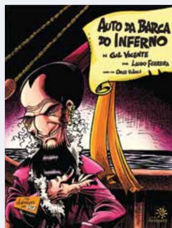
“Auto da barca do inferno” , de Gil Vicente Por Laudo Ferreira R$49 (Peirópolis)