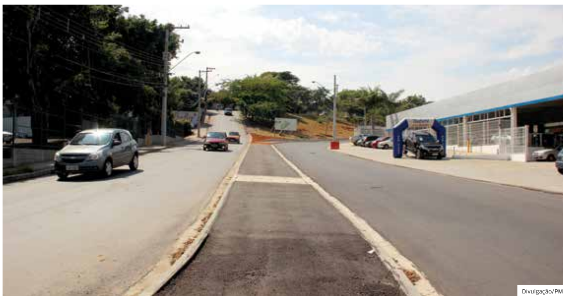
Pacote do CAF. Contrato com a S.O. Pontes incluía alargamento do trecho inicial da Estrada do Barreiro

“A rescisão ocorreu em função de irregularidades cometidas pela empresa, como atrasos na execução dos serviços, medições e pagamento dos funcionários contratados. Previamente houve a aplicação de notificações e multas, conforme determinam os termos do contrato,