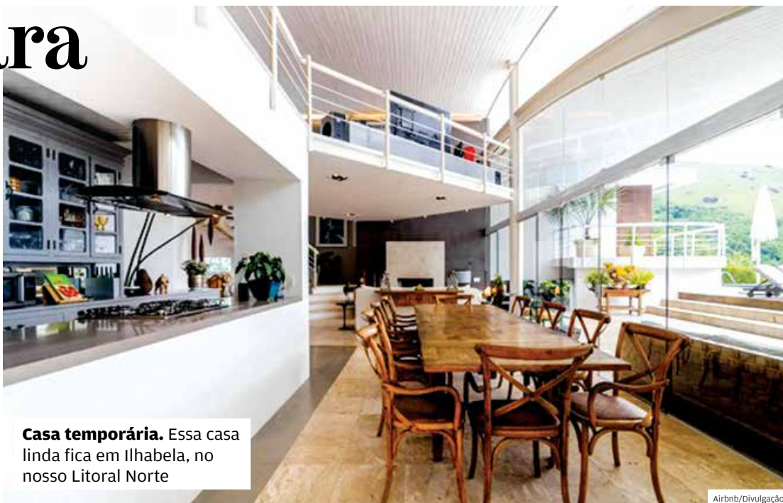
Casa temporária. Essa casa linda fica em Ilhabela, no nosso Litoral Norte

Quer viajar no ano novo? Confira sugestões do Airbnb para quem irá usar a plataforma para buscar o imóvel ideal