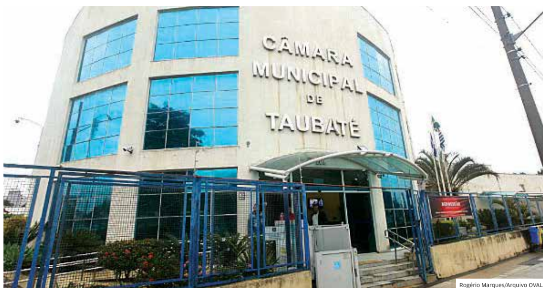
Plano. Recriação do plano de saúde para servidores foi incluída na minirreforma administrativa da Casa

A Câmara deverá subsidiar parcialmente os valores pagos pelos servidores. O percentual não foi definido ainda. No contrato anterior,