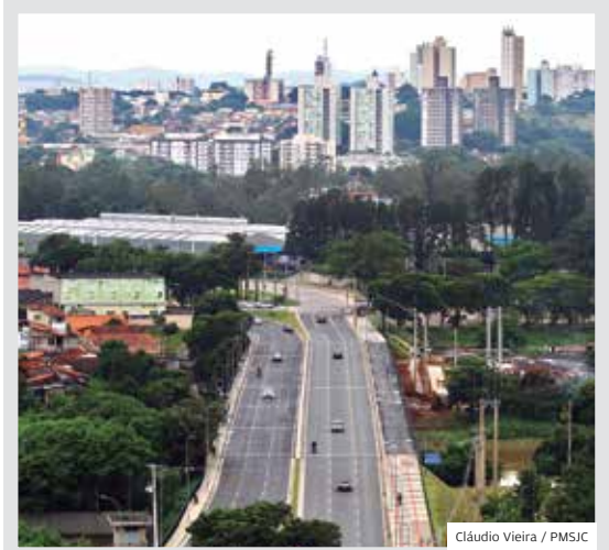
Região Leste. A nova Rotatória do Gás