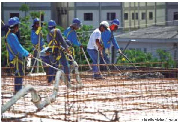
Cláudio Vieira / PMSJC