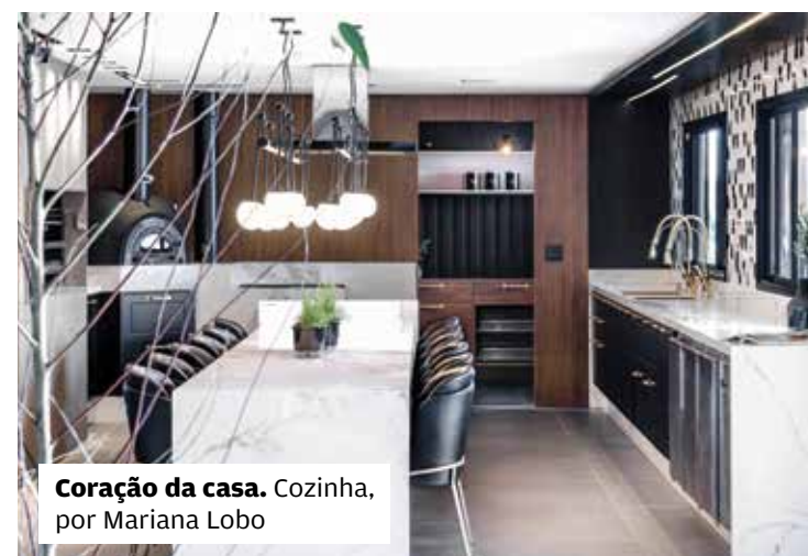
Coração da casa. Cozinha, por Mariana Lobo