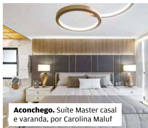
Aconchego. Suíte Master casal e varanda, por Carolina Maluf