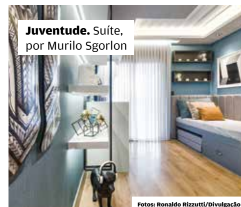
Juventude. Suíte, por Murilo Sgorlon