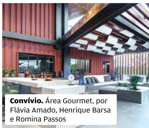
Convívio. Área Gourmet, por Flávia Amado, Henrique Barsa e Romina Passos