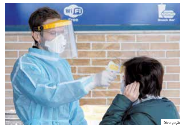
Teste. Agente de saúde mede temperatura das pessoas