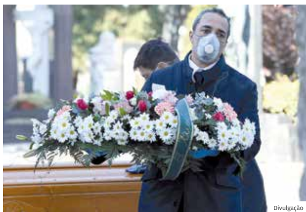
Tristeza. Funcionários do funeral transportam caixão

CORONAVÍRUS IMAGENS SÃO DIVULGADAS DE CAMINHÕES MILITARES AJUDANDO DEVIDO AO GRANDE NÚMERO DE FUNERAIS NO PAÍS INTEIRO