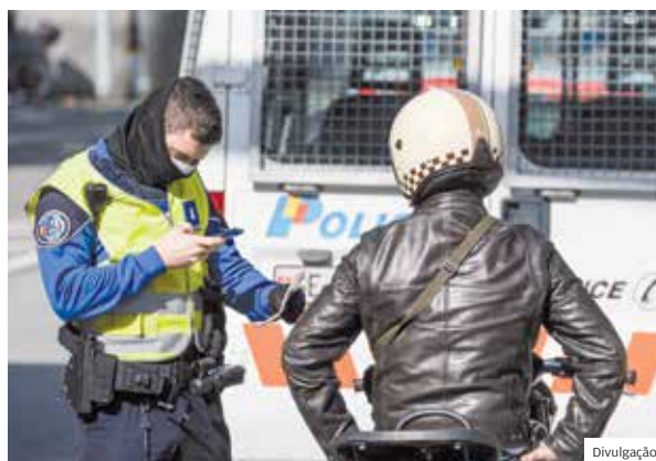
Ronda. Polícia verifica pessoas pelas ruas na Espanha