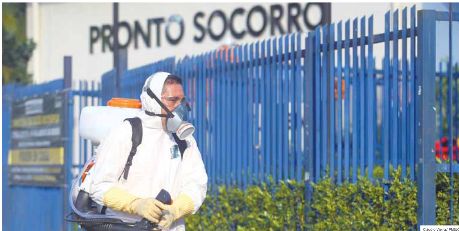
Guerra à pandemia. Funcionário realiza limpeza em frente ao Pronto Socorro da Vilsa Industrial, na zona leste de São José dos Campos

"Temos que olhar as projeções e ver o que vem pela frente. É importantíssimo esse momento. Estamos no começo da epidemia. Nas duas e três próximas semanas vamos conhecer o tamanho