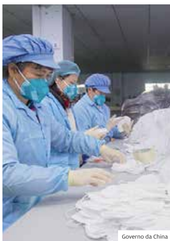
Máscaras. Item é ferramenta de proteção contra o vírus

Estudos recentes demonstram que o uso de qualquer tipo de máscara -- mesmo as feitas em casa, associado à lavagem de mãos e medidas de prevenção comuni-