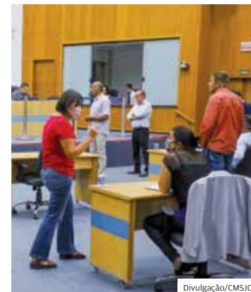
Projeto. Salário de eventuais será antecipado pela pandemia

Um grupo de cinco vereadores chegou a apresentar seis emendas ao projeto de lei, mas elas foram rejeitadas pelas comissões permanentes e