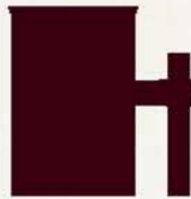
30m Cristo Redentor/RJ