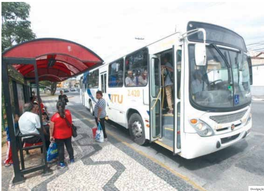
Operação. Sistema de transporte ainda indica uma queda de passageiros com a quarentena em Jacareí

O governo Izaias Santana (PSDB) justifica que a redução de passageiros tem gerado uma arrecadação insuficiente para cobrir os gastos totais da operação, o que provocou o pagamento do custeio pelo