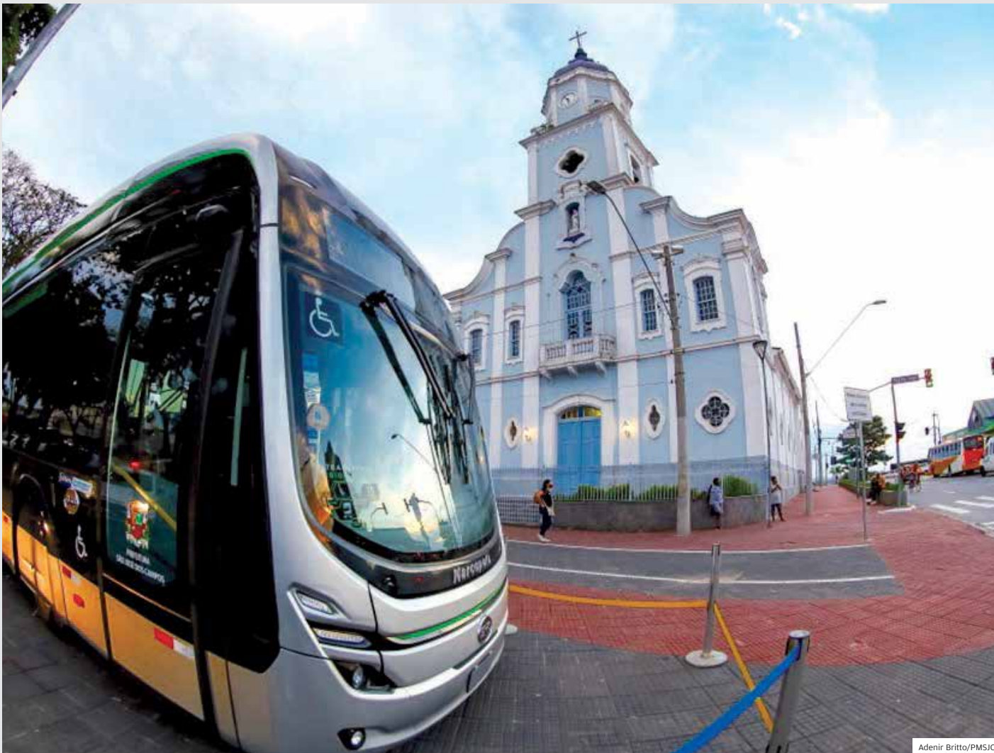
Transporte. Prefeitura de São José dos Campos iniciou esse mês uma exposição itinerante do primeiro VLP (Veículo Leve sobre Pneu)