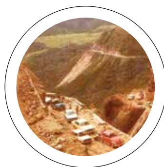
Traçado. Rota moderna surgiu na década de 1970