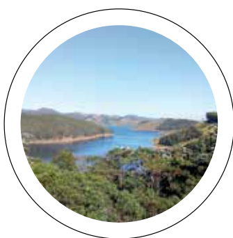
Água. Inundação da represa de Paraibuna cortou trecho