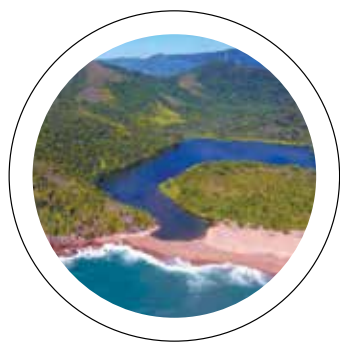
Litoral Norte. Rodovia ligará o Vale do Paraíba à região