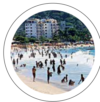
Turismo. Ampliação da rodovia vai propiciar mais movimento