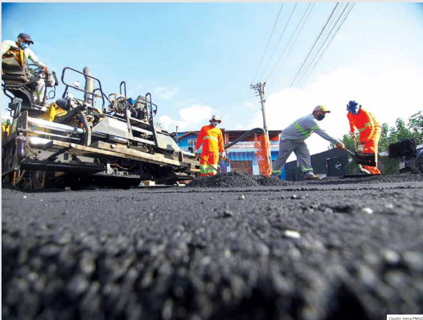
Atraso. Obra da Linha Verde em São José dos Campos. Nos primeiros 11 meses, serviço atingiu 15,9%. Pelo contrato, era para ser 45,8%