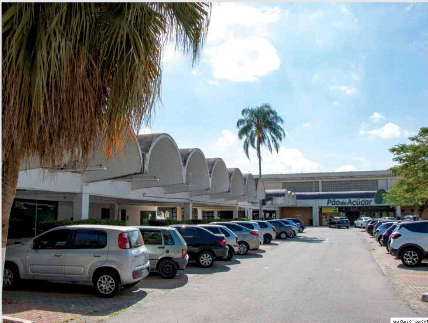
Universidade. Imóvel da Unitau na Praça Monsenhor Silva Barros. Câmara autorizou concessão dessa e de outra área, a Quadra D