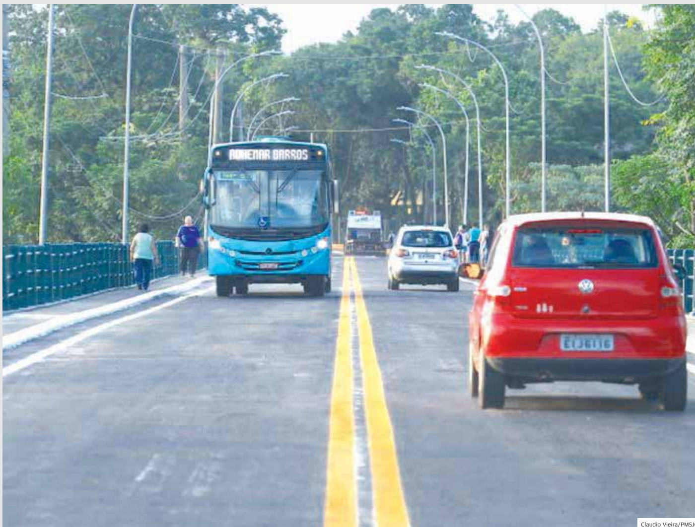
Falhas na concorrência. TCE determinou que a Prefeitura de São José faça adequações no edital para reforma da Ponte Minas Gerais