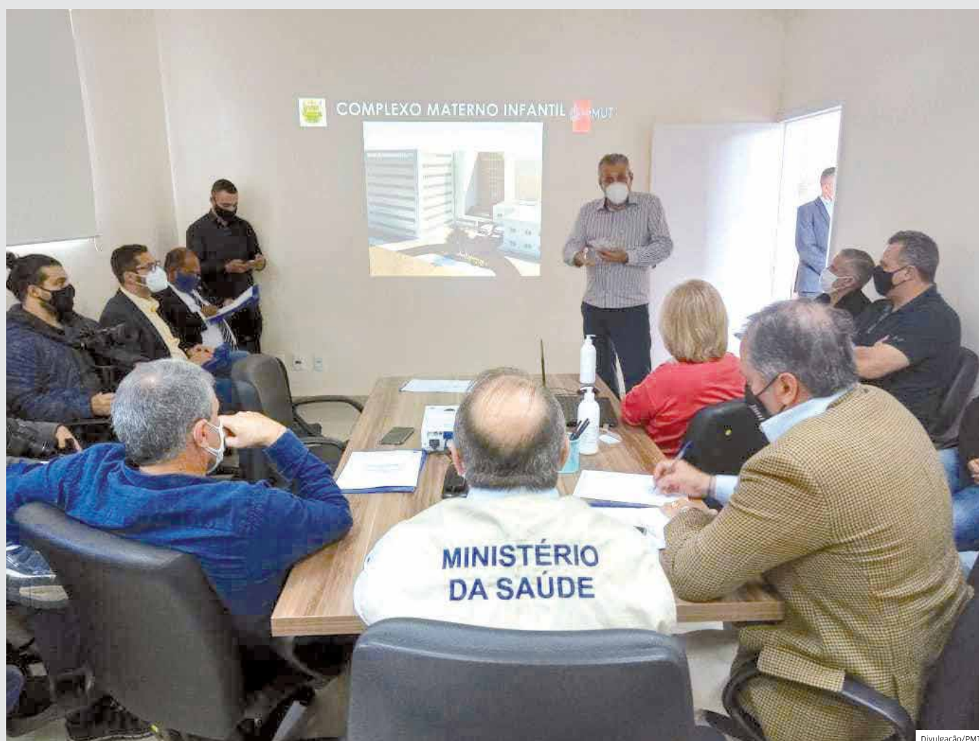
Maternidade. Reunião sobre projeto do 'Complexo Materno Infantil' de Taubaté. Prefeitura pede apoio financeiro do Ministério da Saúde