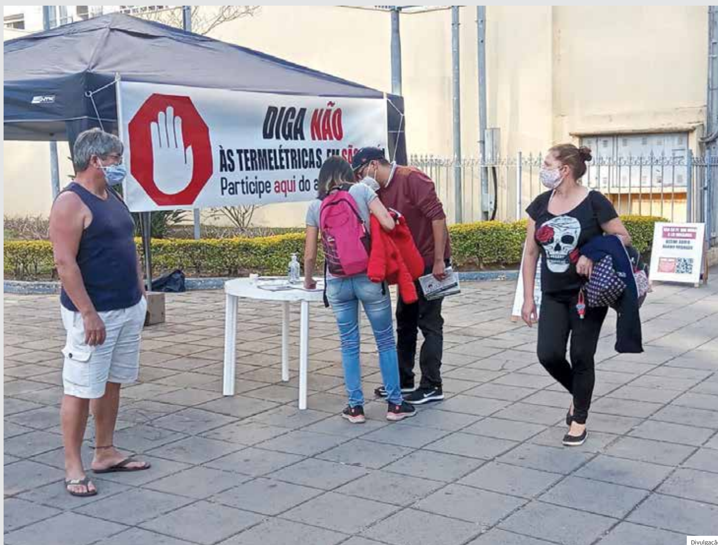
Em busca de adesão. Abaixo-assinado da oposição contra projeto que libera termelétricas no município de São José dos Campos