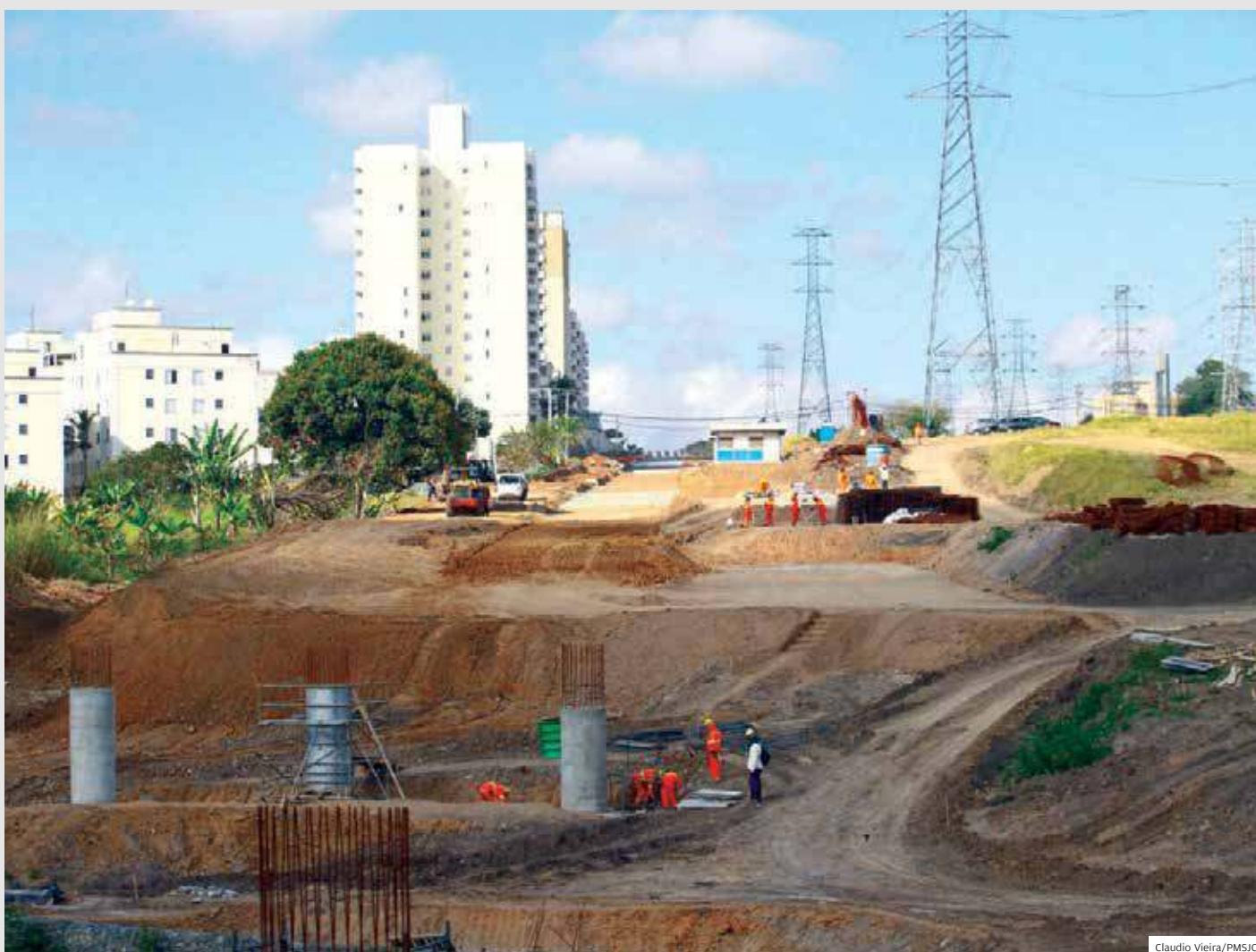
Atraso. Nos primeiros 14 meses de trabalho, a obra da etapa inicial do projeto da Linha Verde avançou só 36,86%. Era para ser 70,24%