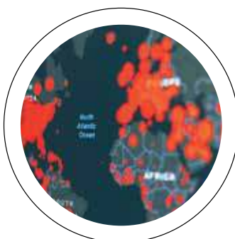
Drama. Covid matou mais do que homicídios e acidentes

É por dia mesmo. Nada matou mais e em tão pouco tempo do que a pandemia.