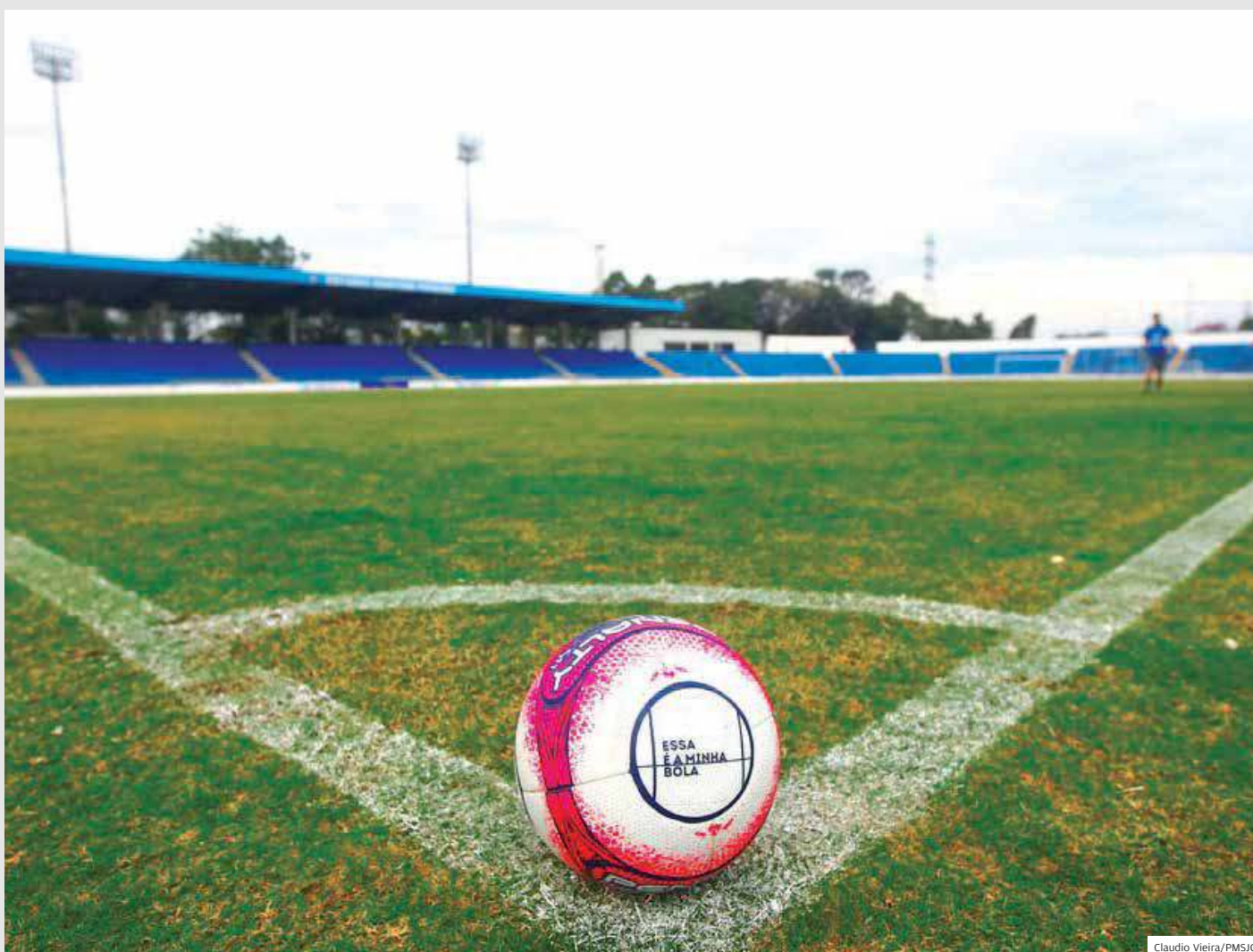
Estádio S/A. A Urbam (Urbanizadora Municipal) publicou um novo edital para a concessão do Martins Pereira. O prazo será de 25 anos