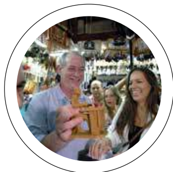
Mudar. Ciro Gomes se apresenta como alternativa