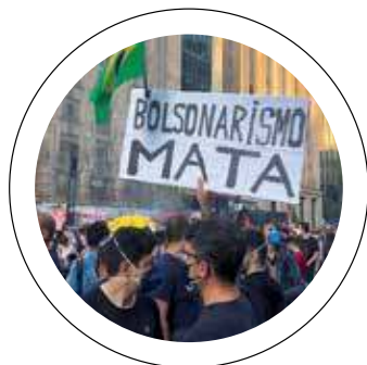
Eleições. Ciro diz que Brasil não aguenta polarização